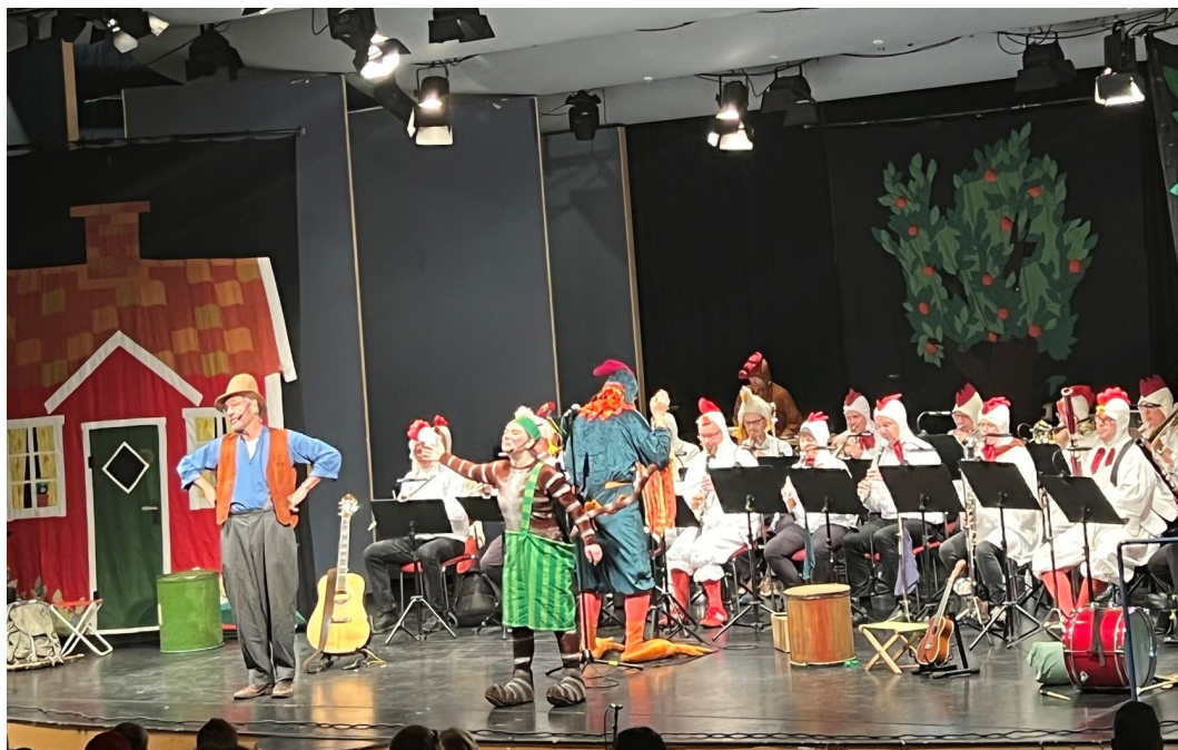
Katten Findus, barnteater i Aulan i Huddingegymnasiet